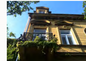
sanierungsbedürftige, historisch gestaltete Fassade

Die Sanierung umfasste das Nachbilden des Traufengesimses. Risse wurden geöffnet und lose Putzteile vorsichtig entfernt. Der neue Putz wurde teilweise händisch, nach an die Putzhärte angepassten Rezepten, gemischt und traditionell aufgebracht. Putznuten wurden nachgezogen und die Risse mit Füllputz wieder verschlossen. Die historischen Fassadenverblechungen wurden nicht getauscht, da diese in Ordnung waren.