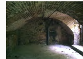
Jahrhunderte altes Gewölbe wies Beschädigungen auf

In einem Winzerhaus wies ein Gewölbe Verdrückungen durch die Lasten der darüber befindlichen Einfahrt auf. Es wurde ein neues Gewölbe unter Tage mit alten Ziegelsteinen nach alter Technik errichtet. Der Zwischenraum zwischen dem beschädigten vorhandenen Gewölbe und dem neuen Gewölbe wurde mit Mörtel kraftschlüssig ausgefüllt. Mit dieser Maßnahme wurde Bausubstanz verstärkt und der Immobilienwert vervielfacht.