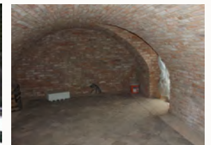
neues Gewölbe nach der Sanierung