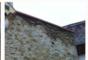
Umgestaltung und Ergänzung mit Naturstein