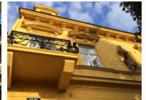
nach der Sanierung ist die Fassade eine Augenweide