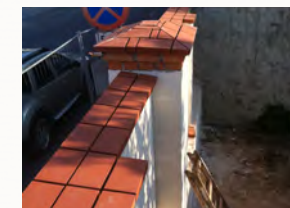
Abbruch und Neuerrichtung einer Einfriedung

Klinkerabdeckungen auf alten und neuen Mauern wurden als Mauerabdeckung verlegt und mit Klinkerfugenmasse verfugt. Natursteinmauern wurden nachgebessert, ergänzt und Fugen ausgebildet. Zugänge wurden mit Granitwürfelsteinen gepflastert, Pflastermulden wurden hergestellt und Granitrandleisten wurden versetzt. Pflasterungen können in jedem beliebigen Naturstein ausgeführt werden.