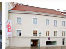
Straßenansicht zum Hauptplatz der WK-Horn