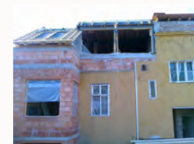
Aufstockung mit Ausbildung eines Betonrostes

Aufstockung und gesamter Ausbau samt Estricharbeiten, Innenputz und Trockenbauarbeiten. Die Koordination mit dem Zimmerer und Vorbereitung des Betonrostes klappte perfekt. Es waren keine Mauerungsarbeiten nach dem Zimmerer notwendig, da die Neigung und die Höhen des Betonrostes richtig ausgeführt waren. Bei diesem Projekt wurde die Straßenfassade klassisch saniert und der Rest mit WDVS eingepackt.