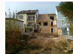
Teilabbruch von Nebengebäuden und Decken

Statt eines Gebäudeabbruches des Wohnhauses und Neubau einer Garage, wurde das alte Gebäude umgebaut. Diese alternative Lösung von Alpson ergab eine Einsparung von ca. 60.000,- EUR, die der Bauherr für andere Zwecke nutzen konnte. Decken wurden abgebrochen, tragende Wände wurden entfernt und darüberliegende Wände mit Stahlträgern unterfangen. Dies war notwendig um eine Doppelgarage zu erhalten.