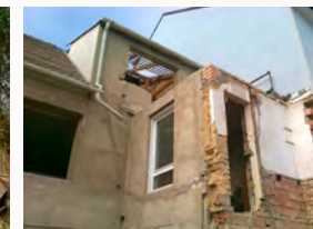
Durchbrüche herstellen und Öffnungen zumauern