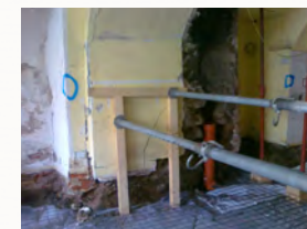
Unterfangungsarbeiten im kleinen Sitzungssaal im EG

Das Bauvorhaben gestaltete sich sehr aufwändig, da das Fußbodenniveau im Erdgeschoss abgesenkt wurde. Die ca. 500 Jahre alten Grundmauern wurden abschnittsweise unterfangen. Decken wurden abgebrochen und durch Gewölbe ergänzt. Bestehende Decken wurden mit Spanschnießen gesichert und mit Aufbeton verstärkt.