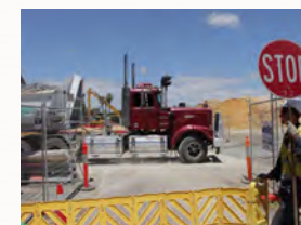
Ihr Baumeister erkennt Gefahren und sichert ab

Sie haben keine Konzession für das Baumeistergerwerbe, wollen aber trotzdem als ausführendes Bauunternehmen tätig sein? Wir vermitteln Ihnen einen Baumeister, den Sie mit 20 Stunden im Monat als gewerberechtigten Geschäftsführer anstellen, bis Sie die Baumeisterprüfung abgelegt haben, oder auch nicht ;-)