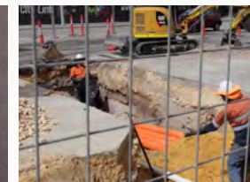
Sichern Sie Ihr Unternehmen aus dem Wissenspool ab