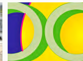
OliviaOffice ist ein einfaches Bauprojektwerkzeug