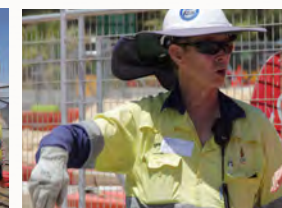
Ihr Baumeister kennt die entsprechenden Gesetze