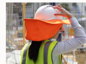
Weltweit Zugriff auf Ihre Daten - papierloses Büro

Sie erhalten einen Zugang ins Rechenzentrum mit dem gesamten Microsoft Officepaket Word, Excel, Access, Projekt, PowerPoint und Outlook je Büroarbeitsplatz. Sie können von überall auf Ihre Daten zugreifen. Zusätzlich erhalten Sie mit OliviaOffice ein schlagkräftiges Werkzeug, mit dem Sie die Kontrolle behalten.